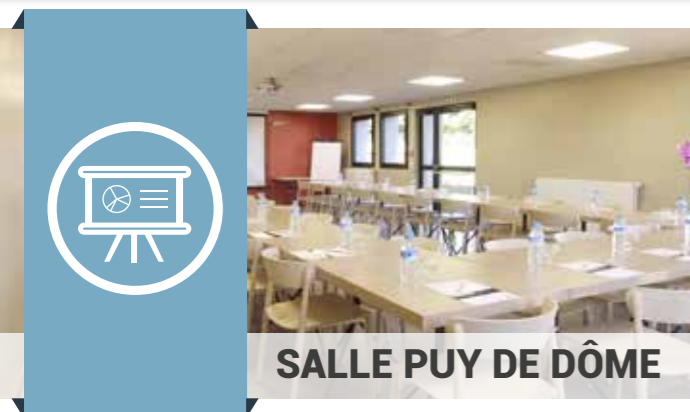
SALLE PUY DE DÔME

Surface : 70 m 2 Capacités : jusqu'à 90 personnes (selon configuration) Équipement : vidéoprojecteur et écran, tableau blanc magnétique, paper-board, tables et chaises, Wi-Fi gratuit.